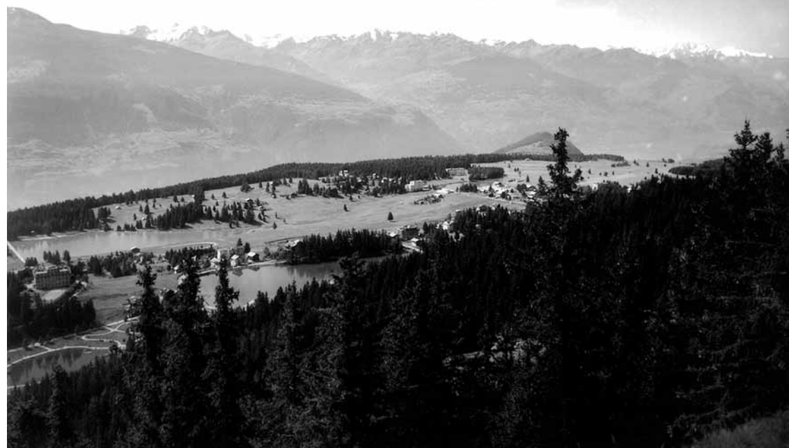
Crans-Montana, vers 1935.

SHVR SOCIÉTÉ D'HISTOIRE DU VALAIS ROMAND